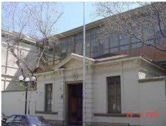
Figura 3.

Este entorno ofrece múltiples oportunidades pedagógicas para la escuela, permitiendo articular el currículum con el patrimonio histórico, cultural y social del territorio. De este modo, el contexto barrial se constituye en un recurso educativo que favorece aprendizajes significativos, el sentido de pertenencia y la valoración del entorno local, fortaleciendo el vínculo entre la escuela, la comunidad y el territorio.