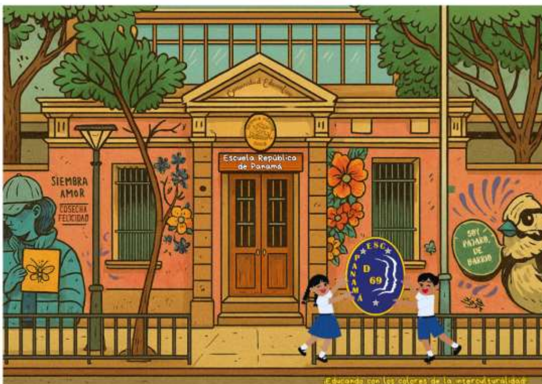
Figura 1. Elaboración propia