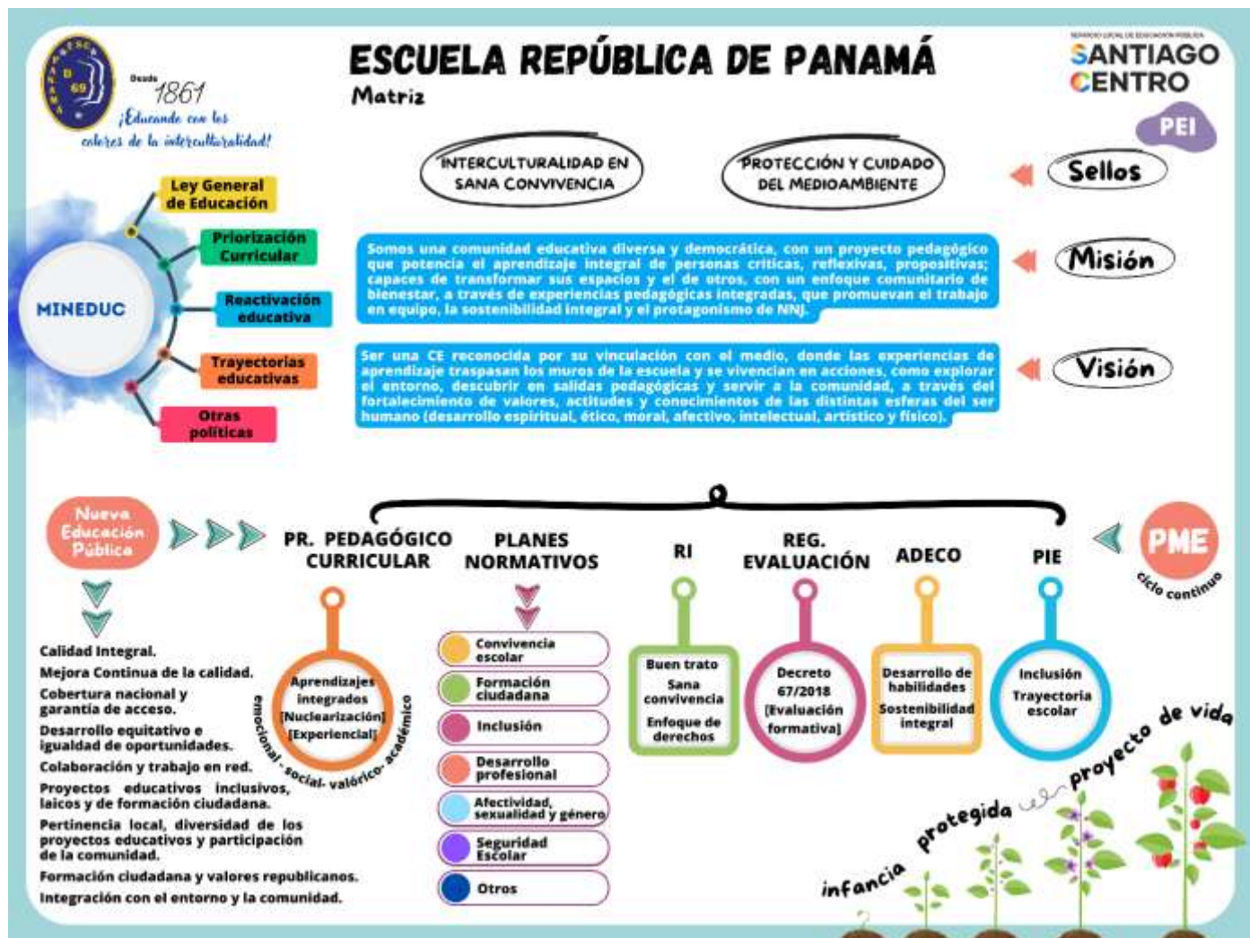
Figura 3. Elaboración Propia