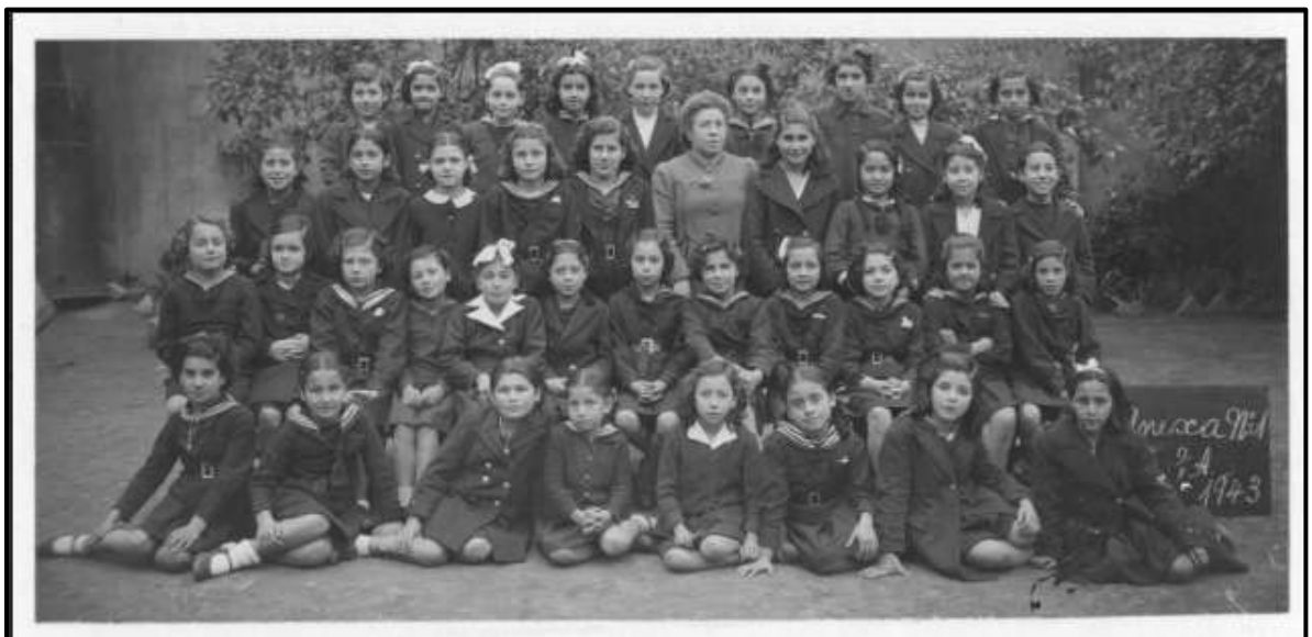
Figura 2. Portal Chile Patrimonios

En el año 1986, la administración del establecimiento fue traspasada a la Ilustre Municipalidad de Santiago, a través de su Departamento de Educación Municipal, mediante el Decreto N°436. Posteriormente, en el año 2014, la escuela se incorporó a la Jornada Escolar Extendida, modalidad que se mantiene vigente hasta la actualidad.